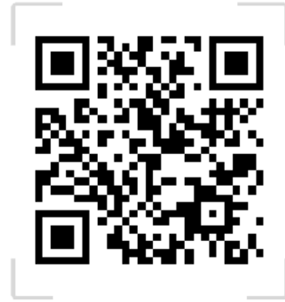
第二章 公共事业管理